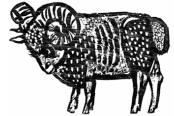
"ATELIER - Laines d'Europe"